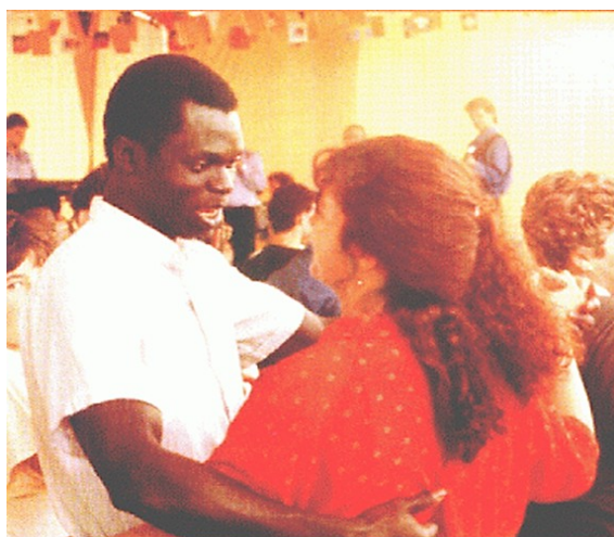
Las Cartas de Alou

porque desenvolvem a relação da representação mutilada do imigrante desde uma voz própria, fragmentada, dividida no âmbito da receptividade negativa e da incorporação difícil, ao mesmo tempo em que trabalham o tema da coexistência problemática dos espaços, dos acordos provisórios e negociados em lugares essencialmente conflitivos 13 .