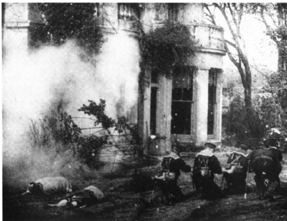
Figura 7: Attack on a China Mission (1900) mostra a interação entre vários atores e tiros de festim

O fotógrafo George Albert Smith foi uma peça importante nos primeiros anos do cinema. Ele cobriu parte de um de seus cenários com veludo preto e fez a filmagem de um plano. Rebobinou o filme e tornou a expô-lo incluindo a imagem de um fantasma que parecia flutuar pelo cenário original. Foi também um dos primeiros a filmar uma ação e projetá-la em reverso, movimento esse que ficou conhecido como phantom ride (movimento fantasma) – cuja experiência visual era obtida colocando a câmera em frente de um trem em movimento, dando a impressão de se estar flutuando no ar. Dois filmes contemporâneos tornaram famoso o phantom ride : Shoah (1985) e Titanic (1997).