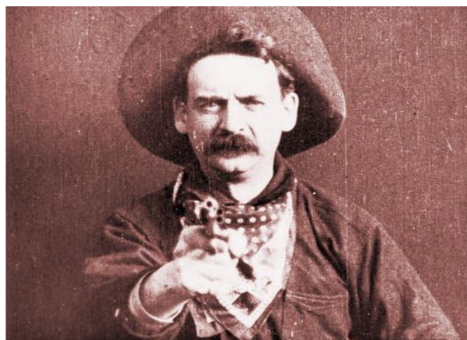
Figura 11: The Great Train Robbery - primeiro faroeste do cinema

As técnicas de filmagem usadas por Porter – filmagens de cenas fora dos estúdios, movimentos de câmera, montagem paralela e o formato faroeste –, em The Great Train Robbery , de certa maneira inauguraram o cinema moderno. Com seus 11 minutos de duração e 14 sequências de um plano só, o filme possui a narrativa com ritmo e suspense, uma prévia do que seria mais tarde denominado como uma narrativa clássica, com um enredo com início, meio e fim, guardando ainda, no final, a cumplicidade do público espectador, que é pego de surpresa ao ser ‘descoberto’ como testemunha de toda a ação (figura 11).