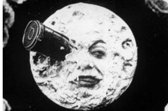
Figura 10: imagem da cena mais famosa de mostra Viagem à Lua : um foguete no olho da Lua

Machado conta que nas obras de Méliès podemos identificar traços de continuidade ou de coincidência, como ressalta, entre as formas pré e pós-cinematográficas: