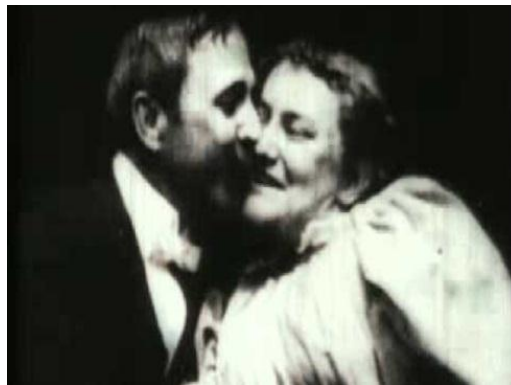
Figura 3 – cenas do cotidiano – marca registrada no futuro

Como já sabemos, no início, as primeiras produções eram praticamente de caráter documentário que mostravam cenas cotidianas simples ou trucagens visuais, mas outros gêneros cinematográficos surgiram logo em seguida. Georges Méliès assistiu à apresentação dos irmãos Lumière e inspirado pela tecnologia apresentada, começou a produzir filmes de fantasia, terror e ficção científica. No início praticamente tudo que era produzido era filmado em plano geral ou primeiro plano (do peito para cima). O filme Le Baiser der May Irvin et John C. Rice ( O beijo de May Irvin e John C. Rice , Edison, 1896 – figura 3) além de ser um bom exemplo de primeiro plano (não foi o primeiro da história do cinema), mas a cena, com certeza obteve grande êxito e como disse Sadoul “o seu erotismo ingênuo anunciava a conclusão de mil outros filmes com um final feliz.” (SADOUL, 1963, p. 19).