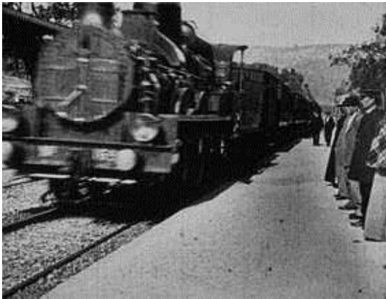
Figura 1: frame da chegada do trem à estação primeira apresentação pública de cinema - 1895

ausência de barreira de linguagens assegurou que o nascimento do cinema fosse realmente internacional e que os filmes da primeira década fossem mostrados pelo mundo todo” (COUSINS, 2013, p. 18).