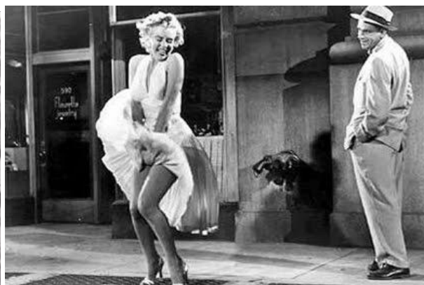
Figura 5 – referência clássica - cinema de atração na década de 1950

Para suprir essa carência, muitas apresentações contavam com a presença de um “explicador”, que esclarecia o sentido da história através da sequencia das imagens. Costa (2008, p. 55) explica que havia outra maneira do público entender o filme que não fosse através do explicador. De acordo com ela, a compreensão desses filmes acontecia naturalmente se o assunto tratado fosse previamente conhecido desse espectador, ou ainda, se a narrativa fosse tão simples a ponto de ser entendida pelo público sem ajuda externa. É o caso do filme de Edwin Porter, filmado em Nova York, em 1901, What happened on Twenty-Third Street (figura 4), cuja cena mostra uma mulher que passa por um túnel de vento e tem sua saia levantada pelo ar que sai de uma tubulação de