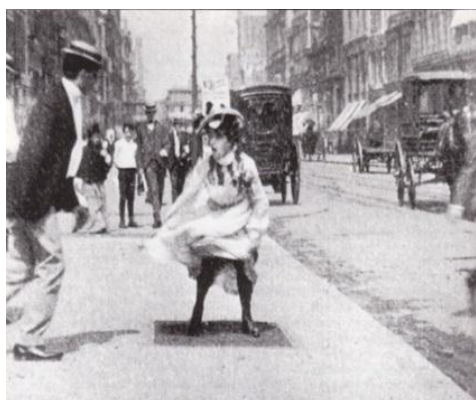
Figura 4 – cenas do cotidiano – cinema de mostração

difundidas pelas exibições dos irmãos Lumière. Como passar dos anos, começou-se a observar a criação de uma linguagem cinematográfica, de um novo código de imagens, quando o espectador também desenvolveu papel importante nesse processo na medida em que tem que aprender a entender o que as imagens em movimento queriam dizer. Assim, a linguagem do cinema passou a ser compreendida a partir da repetição de seu uso, visto que no início as técnicas de imagem eram desconhecidas do público.