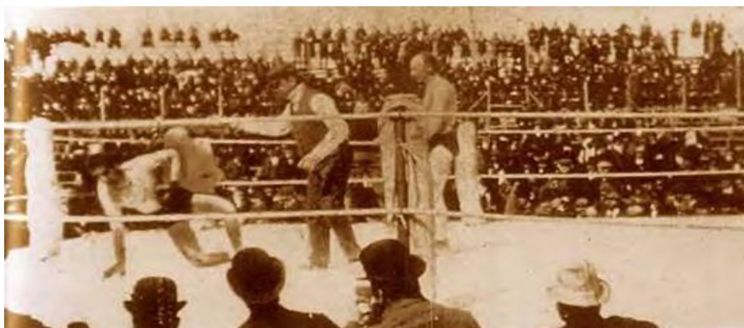
Figura 6: frame do filme The Corbett-Fitzsimmons Fight : um dos primeiros filmes em widescreen

Fernão Pessoa Ramos conta que os irmãos Lumière e seus operadores talvez tenham sido os primeiros cineastas pois “exploravam com incrível agilidade as potencialidades estéticas da imagem-câmera produtora de imagem móvel e inaugurando um padrão imagético: movimento em profundidade de campo, primeiros planos, entrada e saída de campo e, mais do que tudo, um enquadramento refinado” (RAMOS, 1996, p. 143).