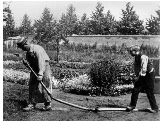
Figura 2: frame de “O regador regado” Lumière - 1886

Costa (2008, p. 23) comenta que os primeiros filmes produzidos para cinema tinham um caráter de espetáculo popular e não eram considerados como diversões sofisticadas e, muito menos encaradas como formas narrativas construídas segundo o modelo das artes nobres da época. De acordo com a autora, no princípio os filmes exibidos eram aqueles que reproduziam paisagens externas e ações do cotidiano, quase que exclusivamente de caráter documentário, como cenas urbanas, as multidões, desfiles de autoridades, pessoas trabalhando e se divertindo, entre outras cotidianidades. O estudioso Tom Gunning também comenta que os primeiros filmes retratavam as curiosidades do começo da vida moderna e “o primeiro século de história capturada pelos filmes” (GUNNING, 1996, p. 24, p.26).